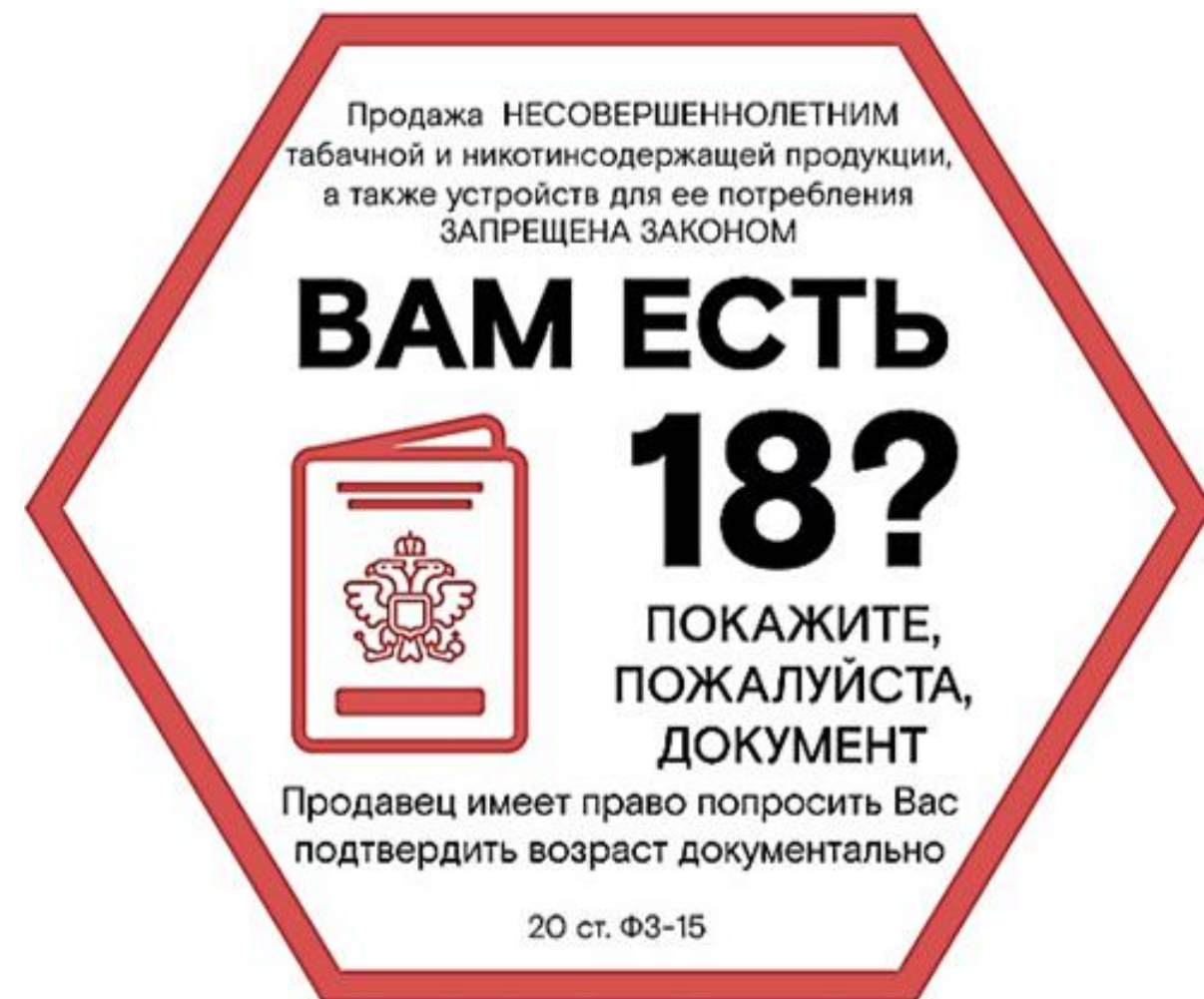
Стикер № 1